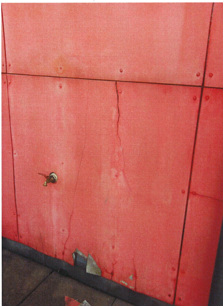
Fig.2 cementovláknitá fasáda stávající stav