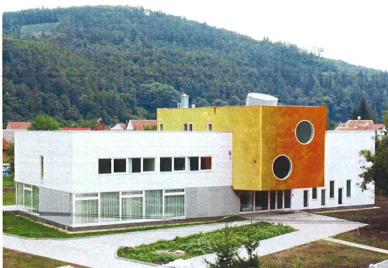
Fig.5 vizualizace barevného řešení