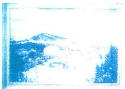
Město z Kuřimské hory

Kluci odrostli, měli už své kamarády a tak opět začalo to báječné putování krajinou, s našimi přáteli, kteří mezitím vyměnili Ivančice za Brno. Na svých toulkách jsme objevili zajímavou cestu Kuřimskou horou přes Babu až do Řečkovic. Toto nádherné polesí začíná u Jánečka u žluté značky a je protkáno spoustou značených cest. Takže nás zavedou nejen do Řečkovic, ale také třeba do Jinačovic, nebo až na Brněnskou přehradu. Touto cestou jsme se někdy s přáteli navštěvovali. Stačilo dojít na půl cesty, tam jsme se setkali, a buď jsme se vrátili k nám anebo k přátelům do Brna.