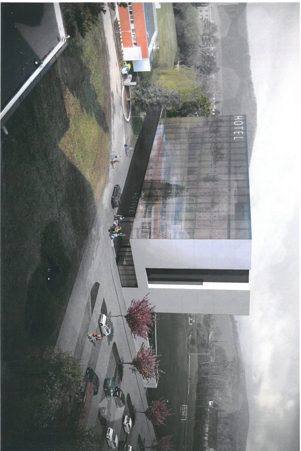
POHLED Z POLIKLINIKY