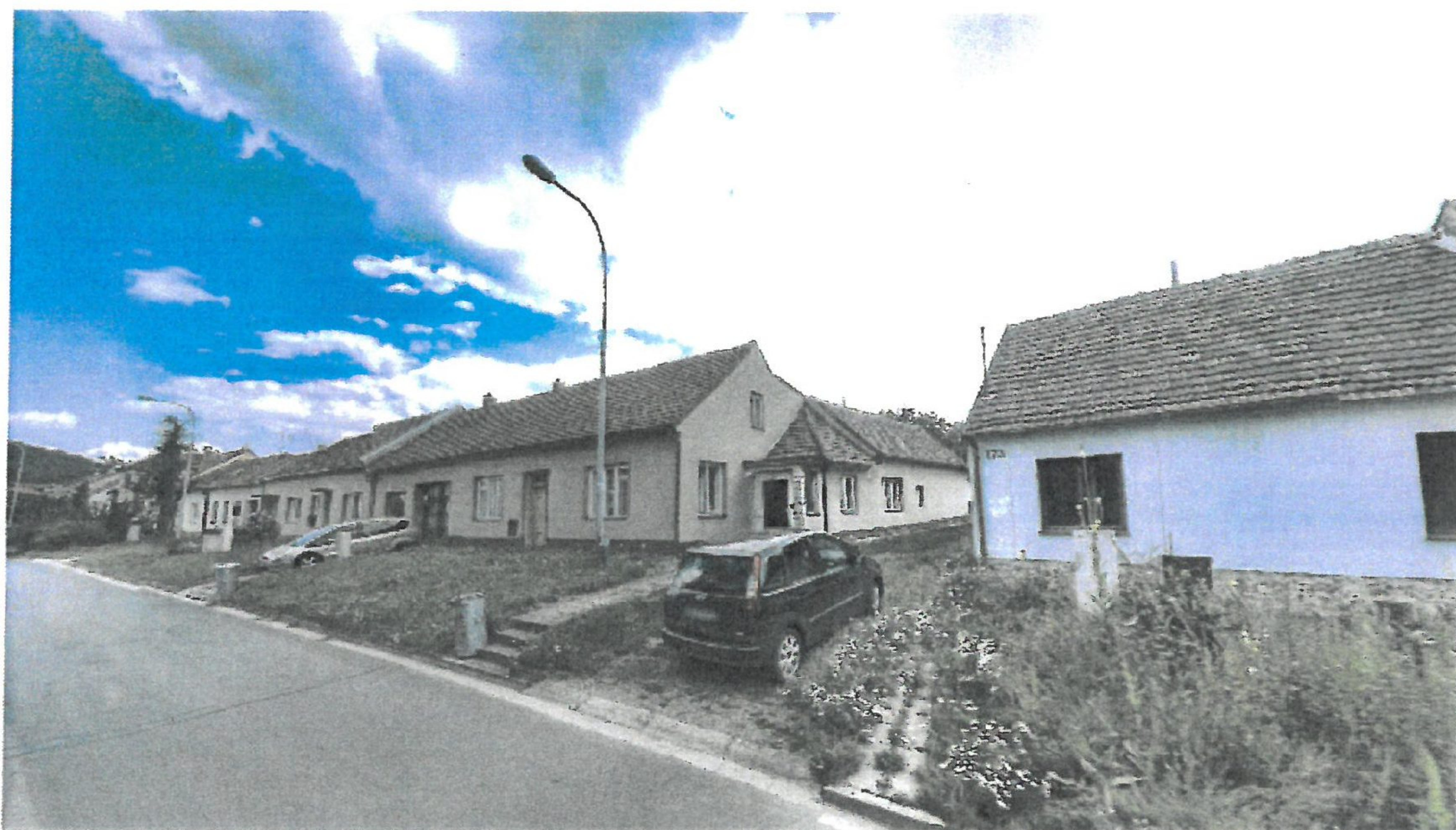
foto místa --