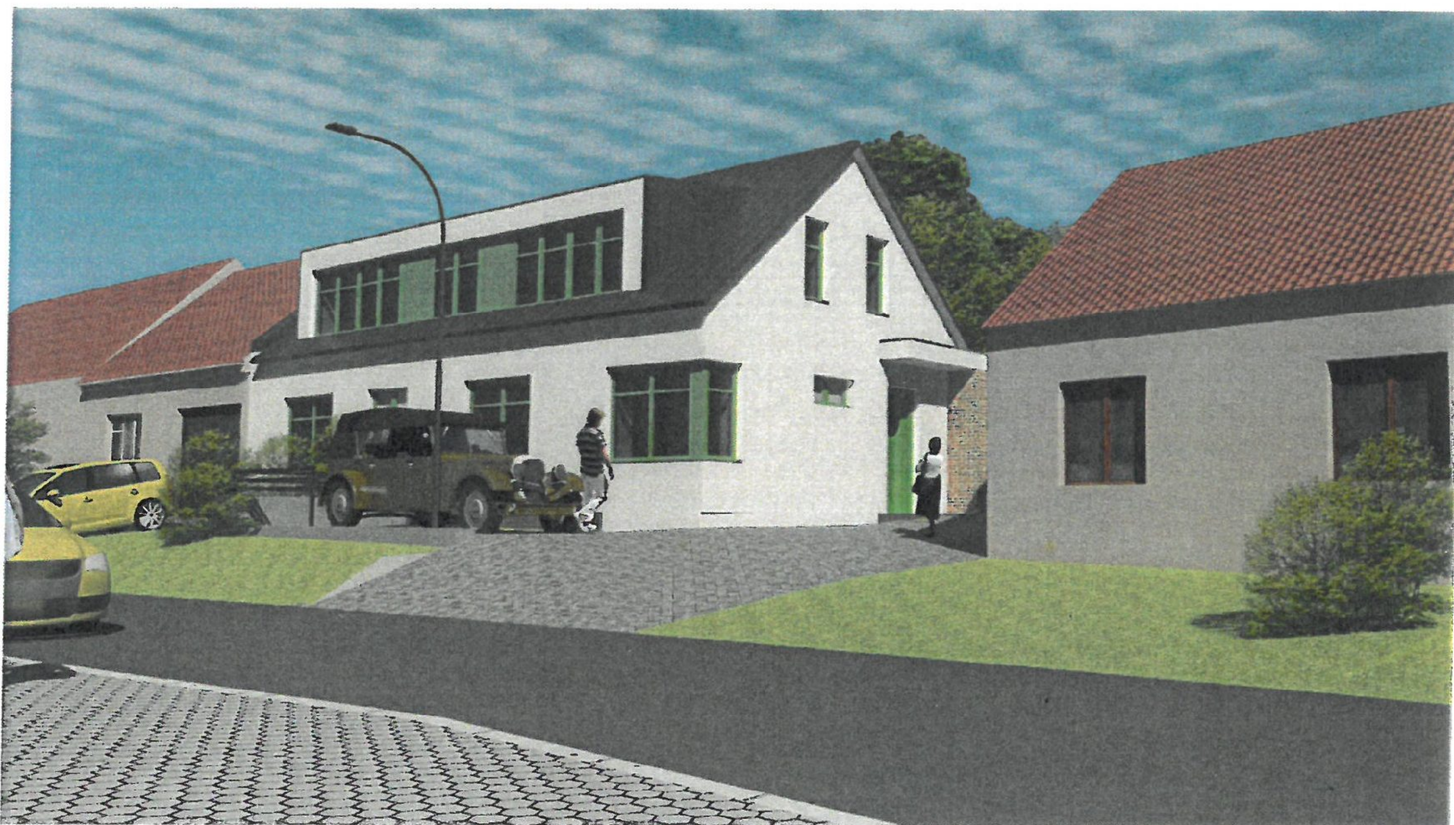
představa o budoucnosti --